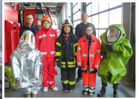
2015 Girls'Day Feuerwehr