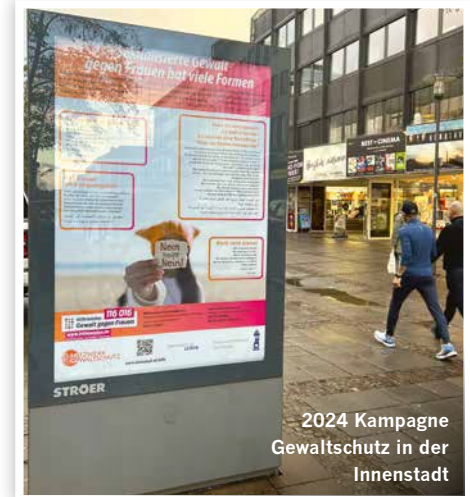
2024 Kampagne Gewaltschutz in der Innenstadt