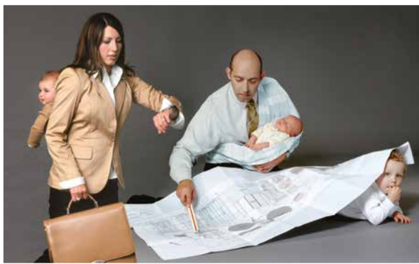
2009 Ausstellung „Hauptsache Arbeit – Mittelpunkt Mensch“