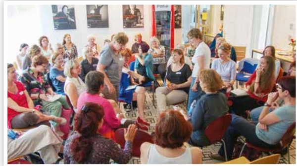
2014 Runder Tisch Frauenpolitische Zukunftswege