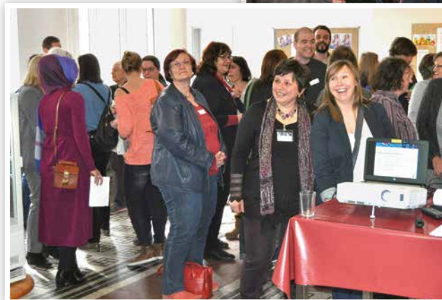
2017 Zweites Plenum zum Gleichstellungsaktionsplan