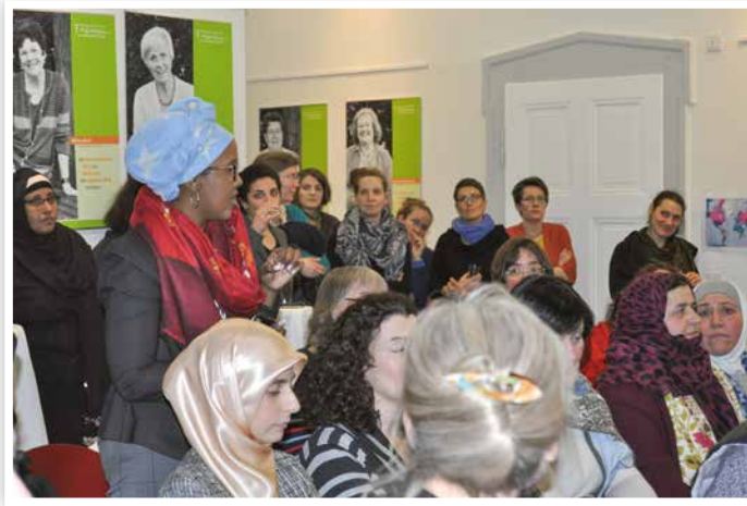
2018 „Darmstadt wird gerechter“ – Infos zu Frauenpolitik und Beteiligungsmöglichkeiten