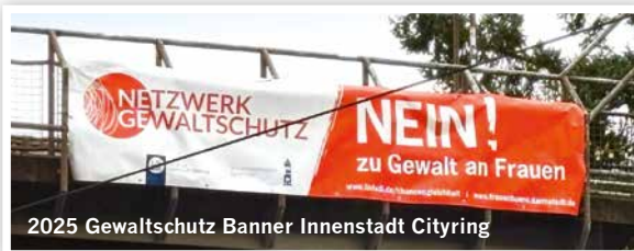
2025 Gewaltschutz Banner Innenstadt Cityring