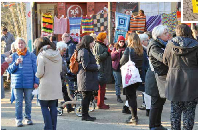
2022 Internationaler Frauentag im Herrngarten