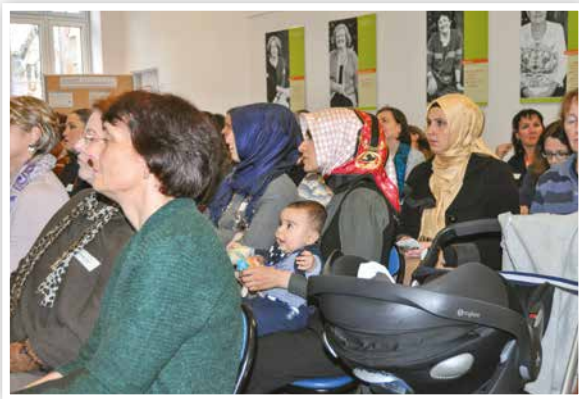
2016 Erstes Plenum zum Gleichstellungsaktionsplan