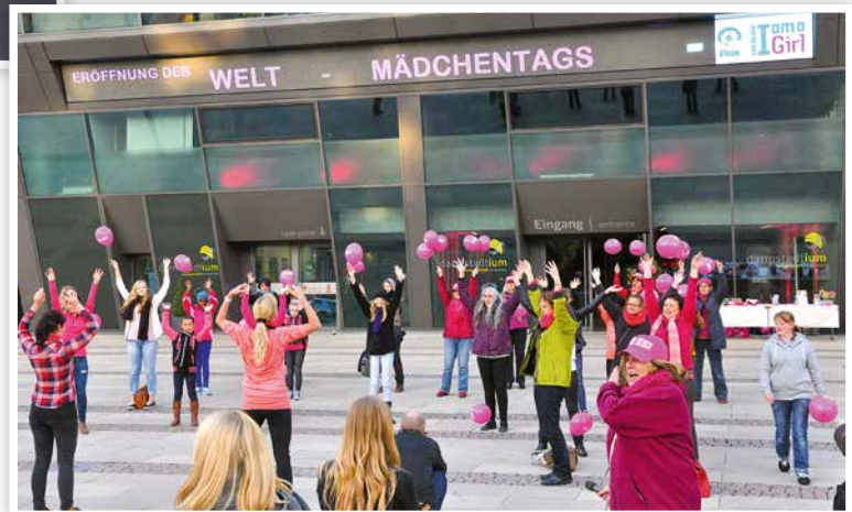
2013 Internationaler Mädchentag