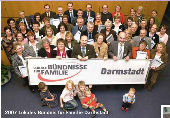
2007 Lokales Bündnis für Familie Darmstadt