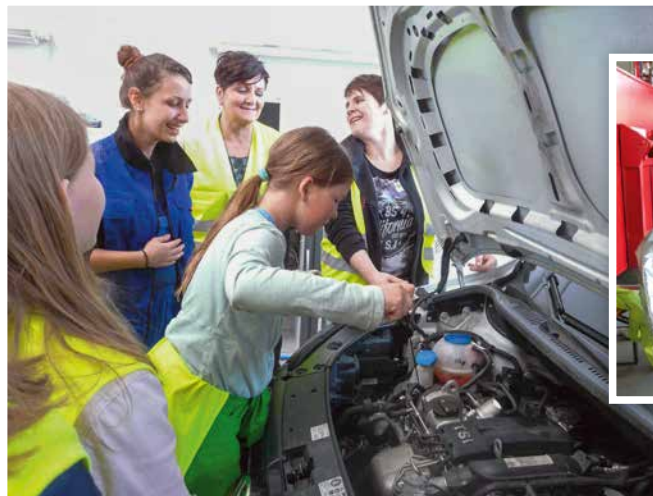
2015 Girls'Day EAD