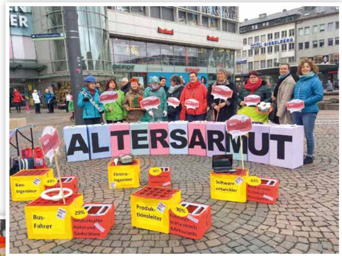
2019 Equal Pay Day