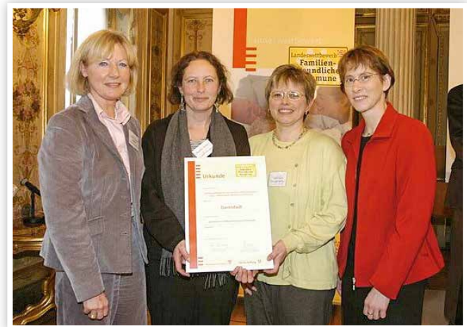
2003 Landeswettbewerb Familienfreundliche Kommune, Berlin

Nach längerer Vorbereitungszeit beschließt die Stadt Darmstadt in Kooperation mit der Bauverein AG den Neubau eines modernen und barrierefreien Frauenhauses. Mit der Erhöhung auf 17 Schutzplätze für Frauen und Kinder erfüllt die Stadt nicht nur die Vorgabe der Istanbul-Konvention sondern das im Grundgesetz verankerte Recht jedes Menschen auf Leben und körperliche Unversehrtheit.