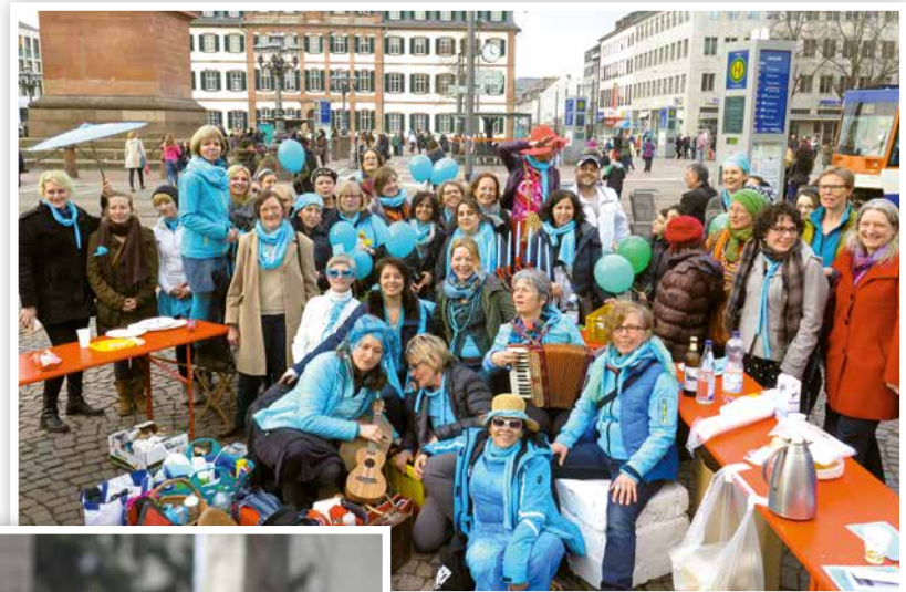
2015 Innenstadtaktion „Frauenleben sichtbar machen“