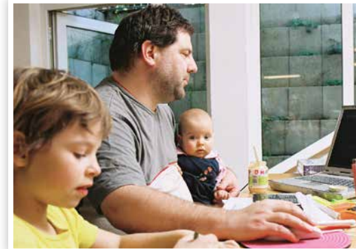
2007 Fratz-Magazin Väter-Fotowettbewerb