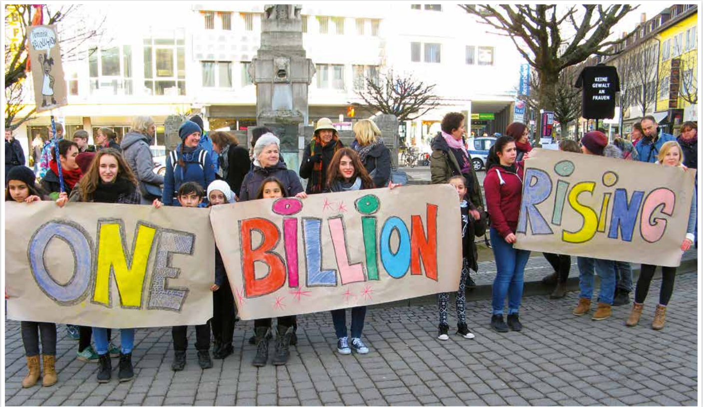
2015 One Billion Rising