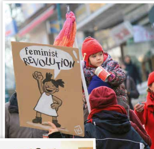
2016 One Billion Rising