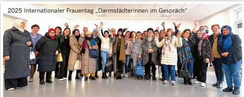
2025 Internationaler Frauentag „Darmstädterinnen im Gespräch“